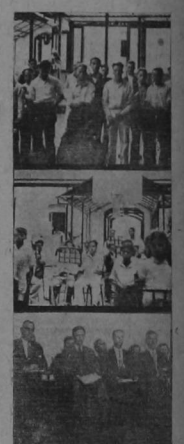
Asistimos recibiendo de la siguiente invitación: "La dirección y personal docente de la escuela de música en unión del señor director Pasa a la Pág. ONCE"

50 alumnos de los cursos superiores hicieron los coros cosechando merecidos aplausos lo mismo que la filarmónica