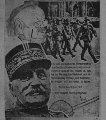
1. Foch.—2. Lloyd George.—Fondo: el nuevo ejército alemán y firmas en el texto alemán del tratado Viola El via al acto de retirar su experiencia de periodista en las negociaciones preliminares del Tratado de Versalles que acaba de celebrarse en su 18 aniversario, nueve céntimos muertos y un décimo paralizado. "El mundo en San Remo, durante la reunión del Consejo Supremo de los Aliados que precedió a la Conferencia de Versalles. Había leído la primera pero aguardábamos aún la plenitud de la paz, la prosperidad y la justicia que iban a llevarnos y automáticamente (PASA a la Página DIEZ)

Los vaticinos de Foch, los temores de Clemenceau, la predicción de Hardieu, las ilusiones de Wilson y las "sabatinas" de Hitler